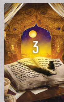
6 kart Celu – Wynalazcy