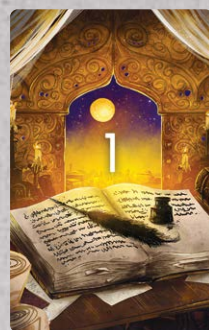
6 kart Celu – Wędrowcy