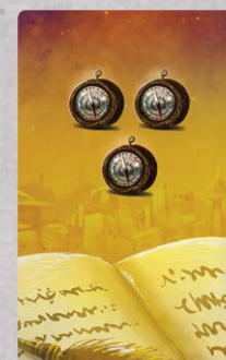
3 karty Dodatkowego Celu