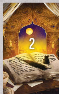
6 kart Celu – Mędrzy