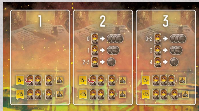
1 plansza Kampanii